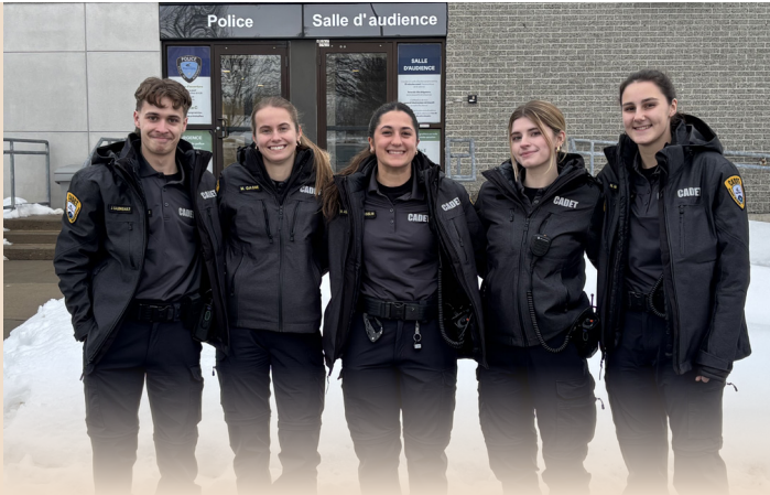
Cadet(te)s policier(-ière)s de la Ville de Repentigny ▲

N'oubliez pas que sauf exception, le stationnement de nuit est interdit dans les rues entre minuit et 7 h, et ce, jusqu'au 31 mars. Pour éviter une contravention ou un remorquage, vérifiez chaque jour si l'interdiction de stationner est maintenue pour la nuit ou si le stationnement est autorisé. L'information est mise à jour au plus tard à 18 h au repentigny.ca ou au 450 470-3850.