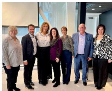
14 mars — Midi-conférence sur les droits des femmes à Repentigny