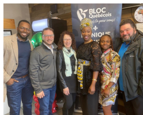
10 février — Regroupement de la communauté noire de Lanaudière