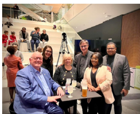
1 er février — Lancement du Mois de l'histoire des Noirs