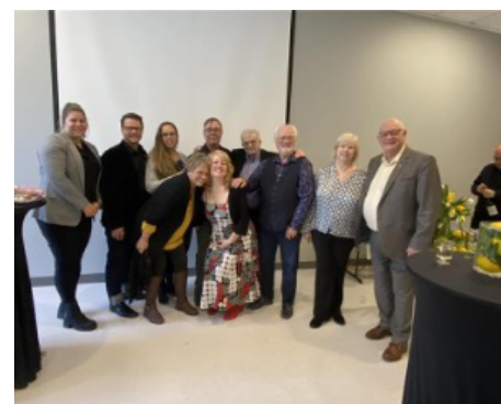
21 mars — Cocktail du 10 e anniversaire de la Popote roulante Rive-Nord