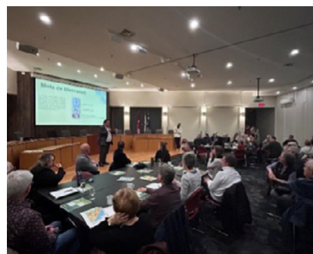
16 mars — Café-rencontre sur la Politique de la foresterie urbaine