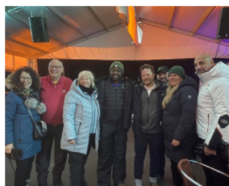
3,4 et 10,11 février — Festival Feu et Glace