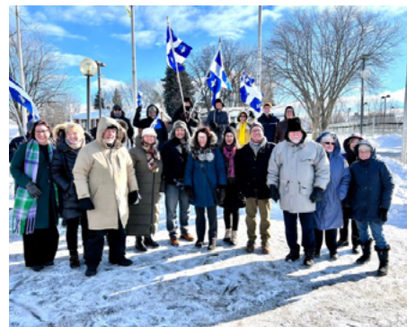
21 janvier — 76 e anniversaire du Jour du Drapeau du Québec