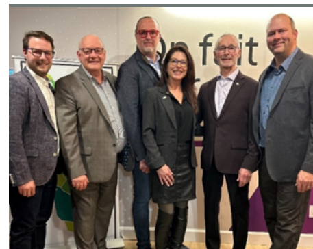
31 janvier — 5 à 7 de la Chambre de commerce de la MRC de L'Assomption