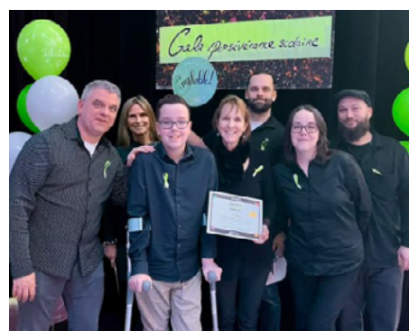
12 février — Gala de la persévérance scolaire de la MRC de L'Assomption