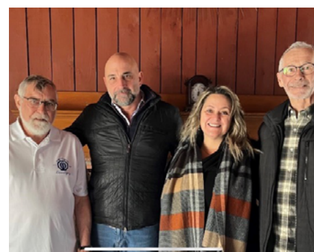
9 mars — Cabane à sucre annuelle avec le Club Optimiste de Repentigny à La Seigneurie des Patriotes à L'Assomption