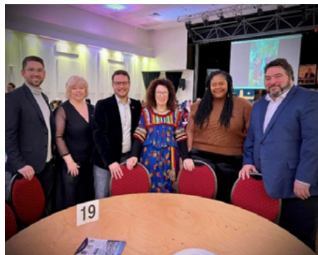
13 janvier — Célébration du Nouvel An berbère avec l'Association kabyle