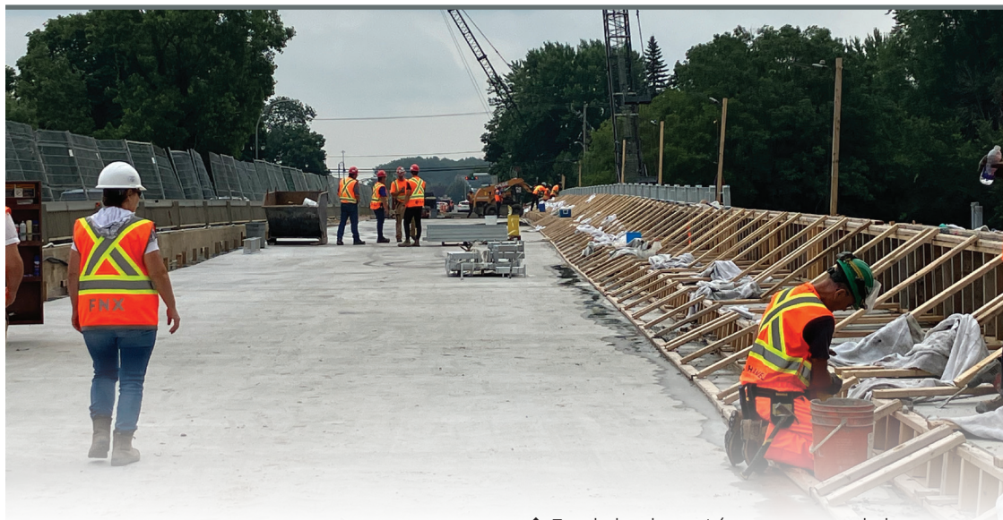
▲ Fin de la phase 1 (construction de la structure qui accueillera éventuellement les deux nouvelles voies de circulation)