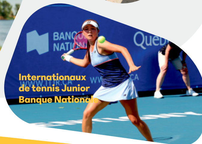
Internationaux de tennis Junior Banque Nationale