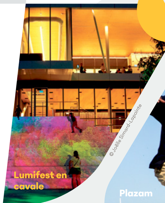
Lumifest en cavale