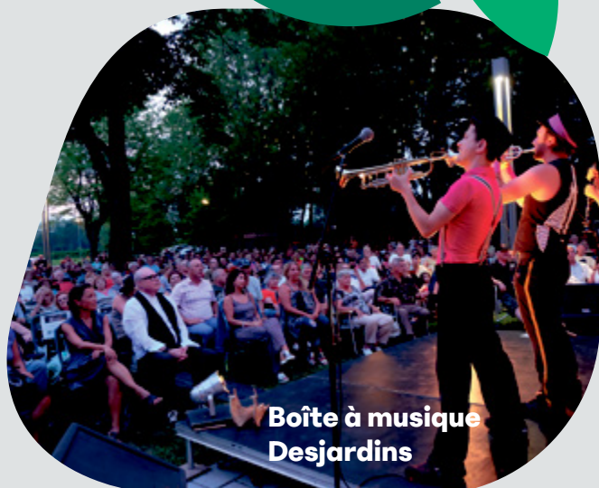
Boîte à musique Desjardins