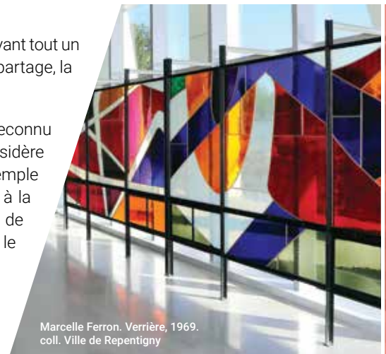
Marcelle Ferron. Verrière, 1969. coll. Ville de Repentigny

Outre le Centre d'art Diane-Dufresne, l'Espace culturel de Repentigny comprendra, à terme, une salle de spectacle complémentaire aux lieux de diffusion existants ainsi que des jardins d'art public.