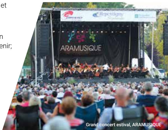
Grand concert estival, ARAMUSIQUE