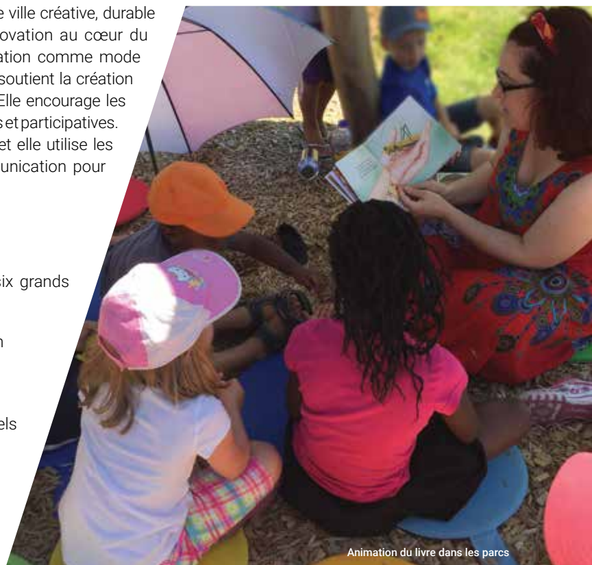
Animation du livre dans les parcs