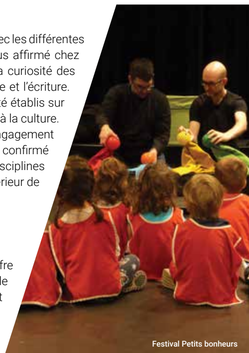
Festival Petits bonheurs

Le défi réside non seulement dans la capacité de développer une offre culturelle de proximité qui puisse exister en complémentarité avec celle offerte à l'extérieur de la ville, mais aussi de communiquer efficacement cette offre. À l'ère où le citoyen reçoit une information riche et abondante, il s'avère essentiel d'utiliser des outils de communication adaptés, permettant de les rejoindre et d'établir un dialogue avec eux.