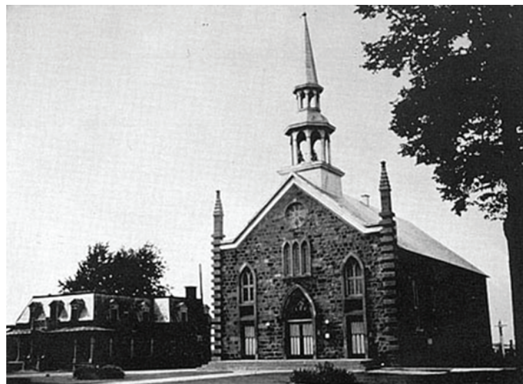
Église St-Paul l'Ermite 377, rue Notre-Dame