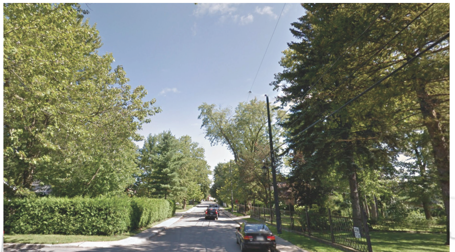
Rue du Village

Les participants seront divisés en groupes de 6-8 personnes. Les thèmes abordés dans les groupes de travail regrouperont les différentes catégories de mesures possibles pouvant être mises en place pour bonifier la protection du patrimoine du secteur, le mettre en valeur et permettre d'encadrer les nouvelles interventions sur le territoire afin qu'elles s'harmonisent avec l'environnement naturel et bâti.