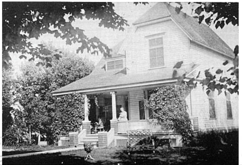
290, rue Notre-Dame

Afin de s'assurer que les recommandations formulées représentent bien ce que les participants souhaitent transmettre à la Ville, chacune des recommandations est lue, une à une, et commentée par les participants. Les ajustements aux recommandations seront faits en temps réel à l'écran.