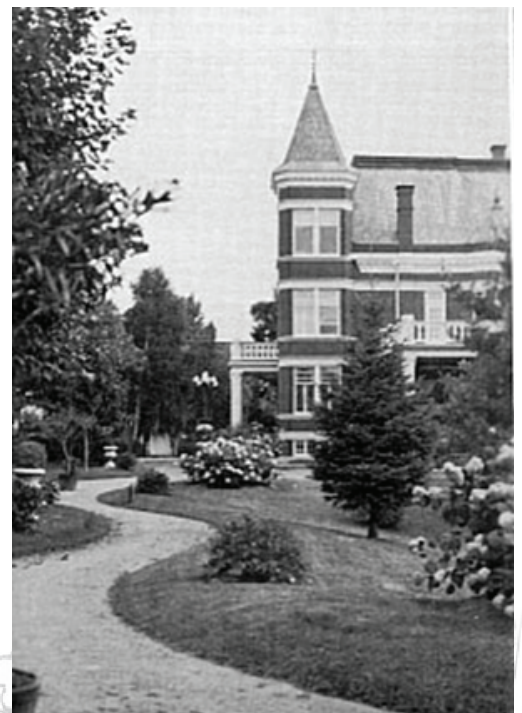
400, rue Notre-Dame

Les recommandations issues des groupes de travail seront présentées et discutées avec les participants et les représentants de la Ville. La Ville présentera ses prochaines actions ainsi que de la date de publication du rapport de consultation produit par l'INM.