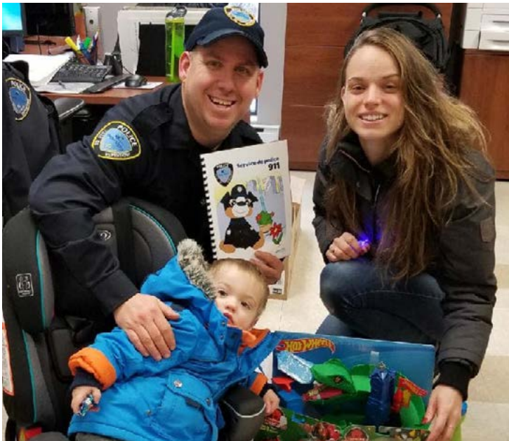
À ce jour, le projet a permis de venir en aide à six familles repentinoises en remettant plus de 20000 $ en biens et en services.

Pour plus d'informations, consultez la page Facebook Un bonheur à la fois .