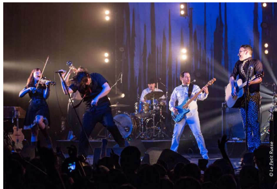
▲ Groupe musical fort connu ici et dans toute la francophonie, Les Cowboys Fringants ont fièrement accepté la présidence d'honneur du 350 e anniversaire de Repentigny.

« Ce sera l'occasion pour nous de fêter en grand avec la collectivité, mais aussi de nous remémorer certains souvenirs marquants[...] » – Les Cowboys Fringants