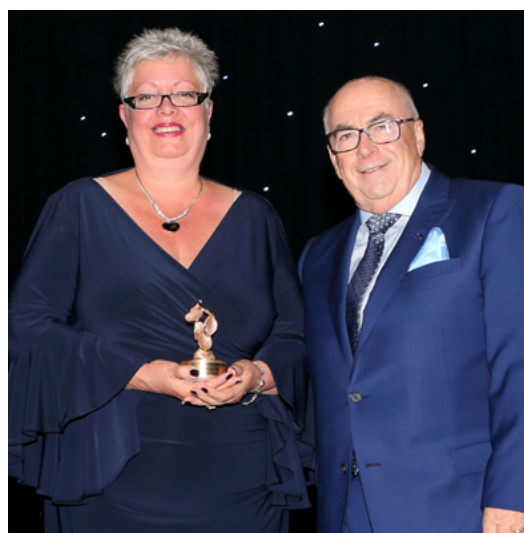
Une soirée colorée, présentée sous la thématique « Disco ». ▶