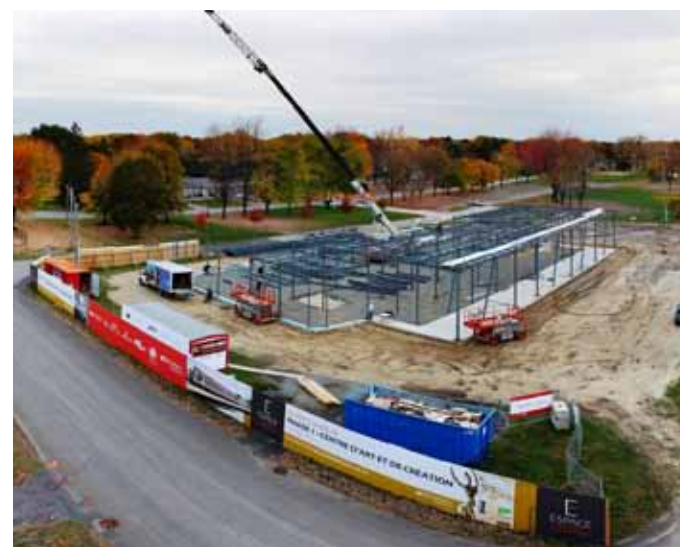
▶ Le Centre d'art et de création, actuellement en construction.

Par ailleurs, je vous mentionne que des travaux majeurs visant la sécurité et la fluidité des déplacements ont été entrepris en vue de l'arrivée imminente du train de banlieue dans le secteur Le Gardeur. Je souligne la réfection et l'élargissement du boulevard Lacombe, que je viens de mentionner, de même que le réaménagement de la piste cyclable sur cette artère névralgique pour la rendre mieux adaptée et plus sécuritaire dans une perspective de promotion du transport actif. Aussi, en périphérie de la nouvelle gare, nous avons procédé au marquage de la chaussée, à l'installation de panneaux de signalisation et à l'aménagement de traverses piétonnières.