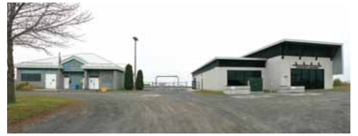
▶ Le nouveau bâtiment construit à la Station de traitement des eaux usées par étangs aérés, située dans le secteur Le Gardeur.