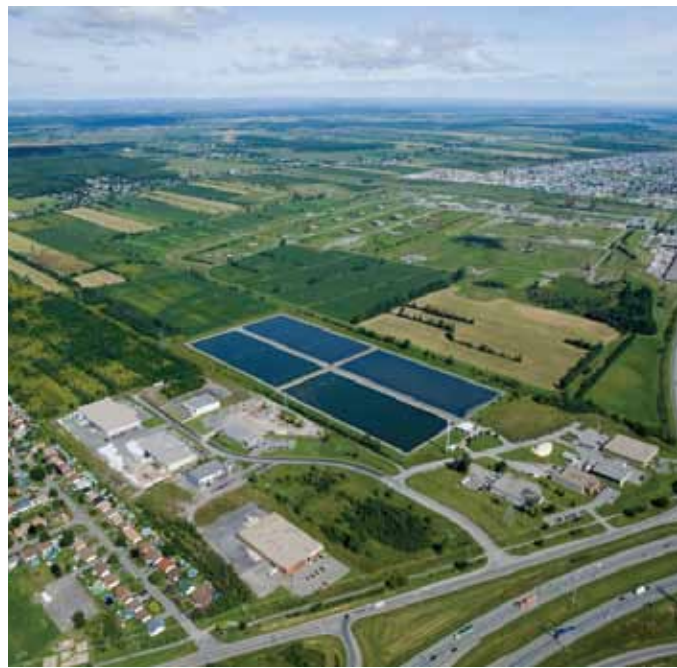
▶ Vue aérienne des bassins de la Station de traitement par étangs aérés.

Au cours de la dernière décennie, près de 45 M$, dont environ 30 M$ proviennent des subventions sur la taxe d'accise fédérale sur l'essence, ont été engagés dans les procédés et les bâtiments de production et de traitement de l'eau afin de répondre aux récentes normes en la matière et ainsi assurer le bon fonctionnement des installations repentignoises.