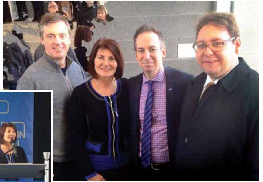
Grand moment de fierté à l'inauguration officielle de la gare Repentigny le 14 novembre dernier.

Afin de permettre aux citoyens de la MRC de L'Assomption d'éviter la cohue et les problèmes de stationnement, le RTCR