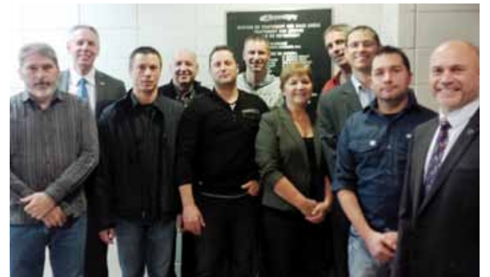
▶ Des employés heureux des dernières améliorations apportées.