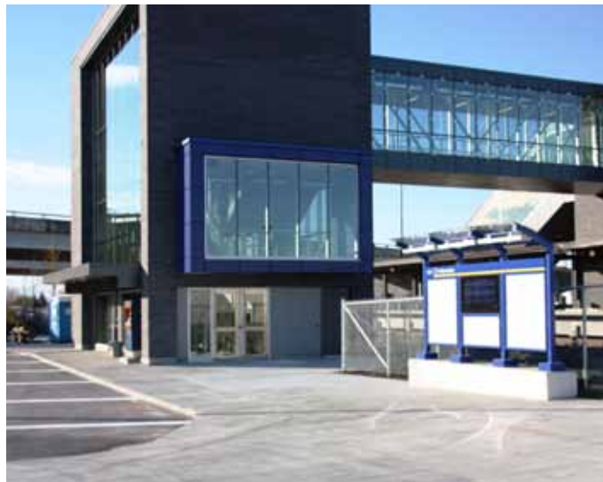
La construction de la gare de Repentigny est terminée. Il ne reste plus que quelques jours avant le grand départ!

Sur le premier palier de la passerelle traversant le boulevard Pierre Le-Gardeur, les usagers pourront admirer L'arbre de la gare, une œuvre de l'artiste montréalais Nicolas Baier. « L'arbre de la gare représente un symbole de paix, de connaissance, de sagesse et de pérennité dans presque toutes les cultures et civilisations. Il crée un sentiment apaisant et harmonieux. On dit que l'art agit comme un miroir du monde, cette œuvre agit comme un miroir de son monde immédiat », explique l'artiste.