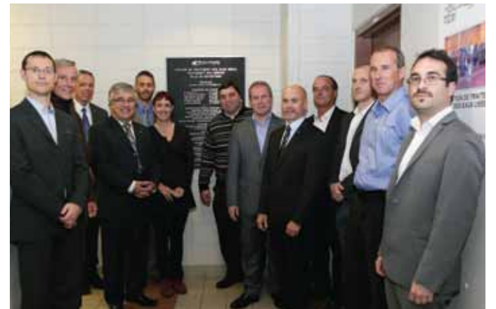
▶ Élus, employés et partenaires prennent la pose devant la plaque de bronze qui marque officiellement la réalisation des travaux touchant l'implantation du système de contrôle des odeurs à la station de traitement des eaux usées située sur l'Île Lebel (STEU).