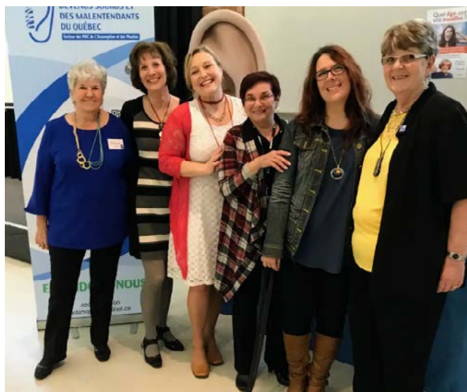
▲ Plusieurs spécialistes de l'audition étaient présents lors de l'événement en avril dernier.

L'Association des Devenus Sourds et des Malentendants du Québec, secteur des MRC des Moulins et de L'Assomption, ont réuni tous les professionnels de l'audition sous un même toit en avril dernier. Cet événement avait pour objectif de permettre à la population de retrouver à un seul endroit toute l'information nécessaire pour prévenir une perte auditive ou mieux vivre avec cette condition.