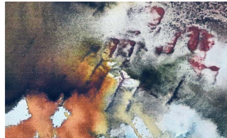
Figure de proue de la poésie au Québec, dans la francophonie et à l'étranger, Jean-Paul Daoust lève le voile sur son parcours littéraire à l'aide d'artefacts tirés de ses archives personnelles. Cette exposition illustre également le travail de l'artiste multidisciplinaire Ginette Trépanier, qui met en scène des créations hybrides souvent saisissantes. Les thèmes abordés dans ses œuvres suscitent des réflexions sur la condition humaine.

Tout au long du parcours, le visiteur découvre une scénographie unique réunissant arts visuels et poésie par le biais de matériaux mixtes, d'installations, de sculptures et de livres d'artistes. La reconstitution d'un studio italien à l'intérieur de la scénographie permettra à Ginette Trépanier de créer sur place et d'animer des rencontres avec les visiteurs. Une exposition à voir jusqu'au 24 mai 2020!