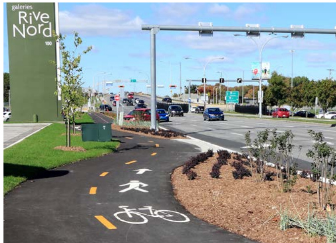
▲ Le nouveau segment sera à la suite du tronçon construit l'an dernier.

Un nouveau segment de piste multifonctionnelle s'ajoutera au boulevard Brien, de la rue Leclerc à l'entrée de l'aréna. Les amateurs du transport actif auront ainsi accès à un réseau plus complet pour leurs déplacements. La Ville procédera également à la réfection du boulevard Brien, entre le boulevard Iberville et la rue de La Fayette. Ces travaux démarreront au cours de l'été. Les citoyennes et les citoyens seront tenus informés des entraves à la circulation dès le début des travaux.