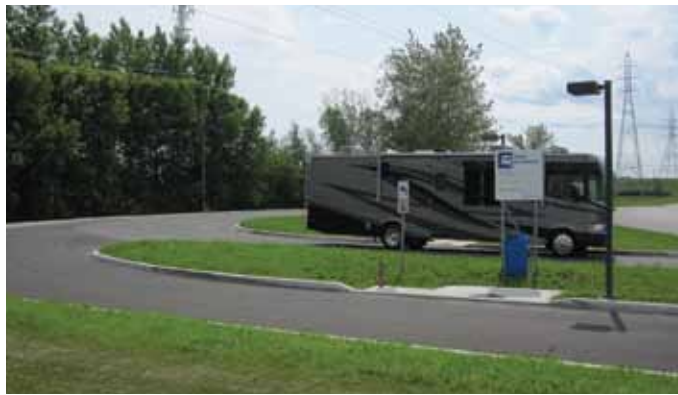
Le site de vidange des VR est situé au 96, rue de la Couronne.

Ce service est offert gratuitement et disponible 24 h sur 24 en libre service, de mai à octobre.