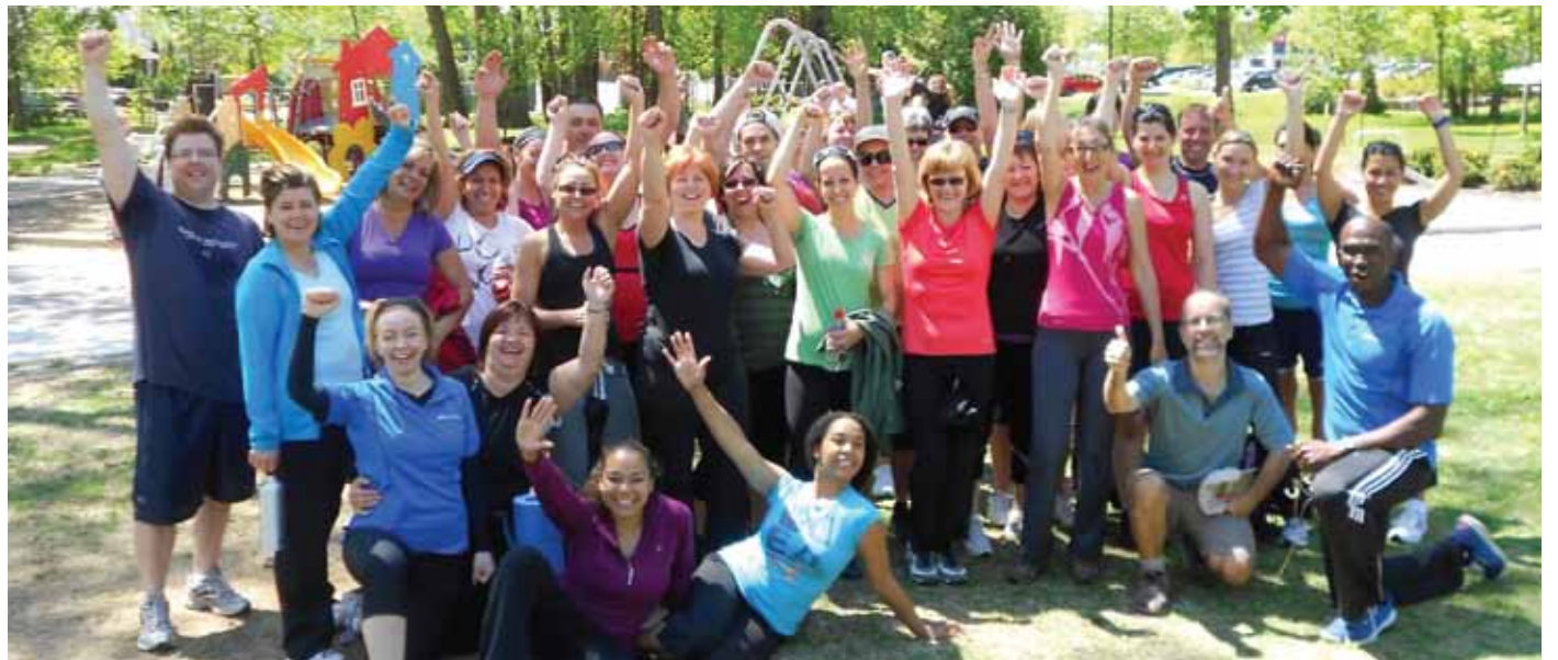
► Un beau groupe d'animateurs et de participants vous attend au Fitness en plein air cet été à l'île-Lebel!