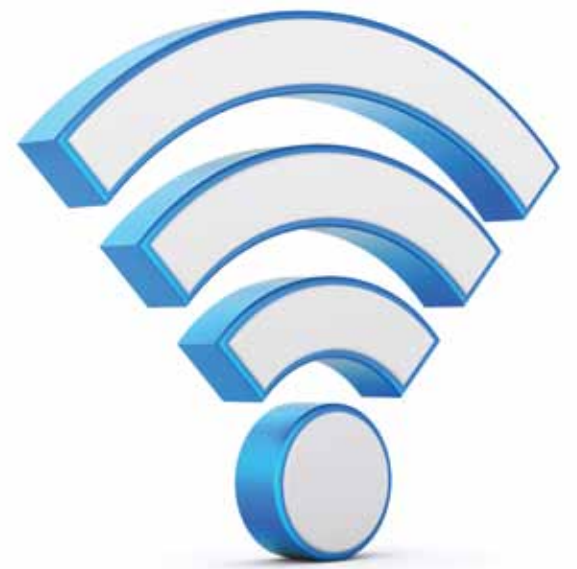
► L'Internet sans fil est gratuit dans sept parcs de Repentigny.

La Ville de Repentigny a en effet mandaté l'organisme à but non lucratif Île Sans Fil pour faire l'installation du réseau sur le territoire. Offrant l'Internet gratuit dans plus de 260 points d'accès à Montréal, l'organisme a des projets avec plusieurs organisations, notamment le CHUM et la Grande bibliothèque. Une entente a également été développée entre Île Sans Fil et le CFP des Riverains afin que l'OBNL partage son expertise avec la relève du centre de formation professionnelle. Les surplus générés par Île Sans Fil à Repentigny seront retournés dans la communauté sous forme de projets WiFi.