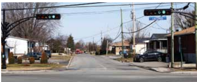
Du boulevard Lacombe à la rue de la Station, la rue Rivest sera complètement reconstruite.

À leur dernière séance publique, les élus repentignois ont adopté un avis de motion décrétant la réalisation d'importants travaux visant la réfection de la rue Rivest, dans le secteur Le Gardeur.