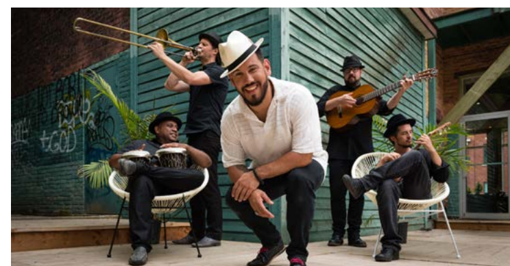
▲ Boogát sera en concert le 15 août dans le cadre de la Boîte à musique Desjardins.

◀ L'Espace culturel a officiellement lancé sa programmation estivale le lundi 3 juin dernier. L'événement a notamment réuni des représentants de la Ville, du Théâtre Hector-Charland, de Récréotourisme Repentigny, de la députation régionale ainsi que des partenaires.