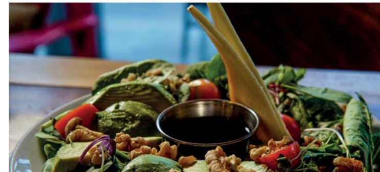
▲ La salade L'Avocat du Roy de la Brûlerie du Roy rappelle la forme du Stade olympique de Montréal.

◀ Le crémeux de foie gras à la tarte Tatin du restaurant Le Coup Monté est inspiré de la région d'origine de Roger Taillibert, le Loir-et-Cher.