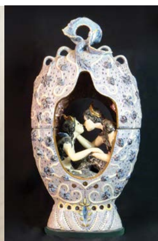
© Huguette Bouchard-Bonet / SOCAN (2019)