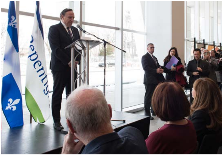
▲ Le premier ministre François Legault a pris la parole.