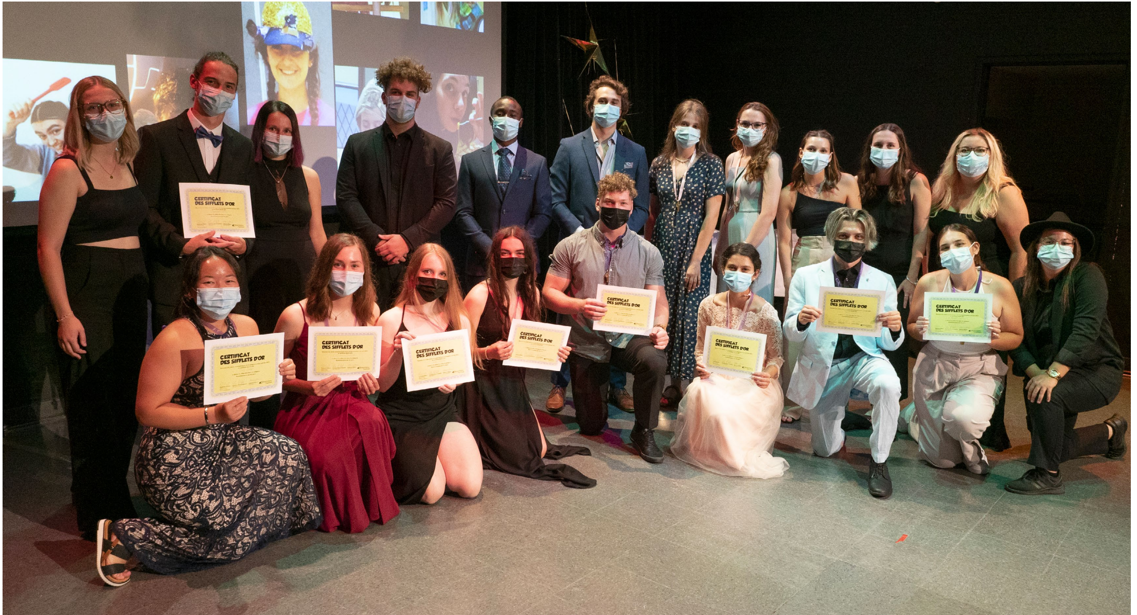
▲ Lauréats lors du Gala des Sifflets d'or 2021.