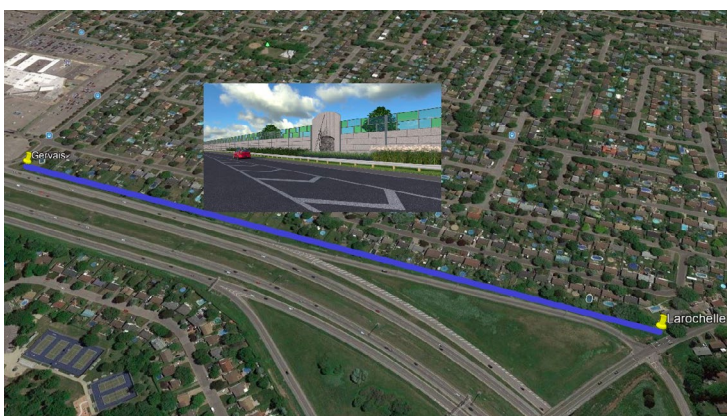
▲ Localisation du premier tronçon en construction

Maître d'œuvre du chantier, la Ville a choisi avec soin les composantes du mur antibruit afin qu'elles répondent à