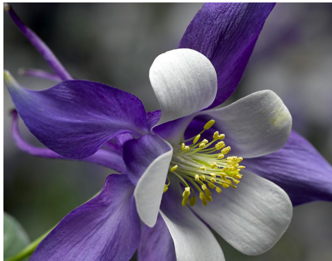
▲ La fleur du 350 e — juin 2020

La Ville tient à remercier tous ses précieux partenaires : Desjardins Caisse Pierre-Le Gardeur et Repentigny Chevrolet (partenaires majeurs), IGA Crevier, Familiprix, Patrimoine canadien et le gouvernement du Québec (partenaires secondaires), ainsi que la MRC de L'Assomption, Hebdo Rive Nord, Imagi Affichage, Galeries Rive Nord, la Microbrasserie L'Ours Brun ainsi qu'Arsenal Média.