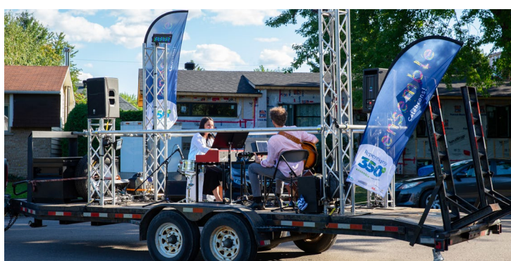
▲ La Grande Tablee — août 2021