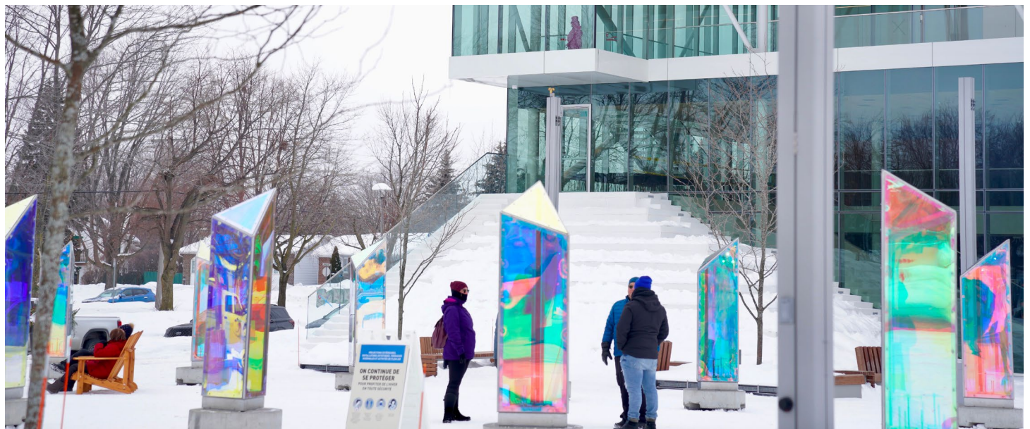
▲ Prismatica — hiver 2021