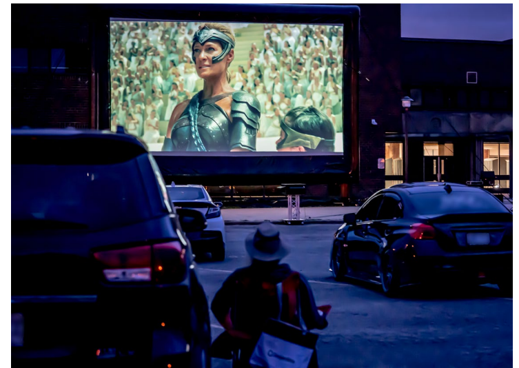
▲ Le ciné-parc éphémère — juillet 2021