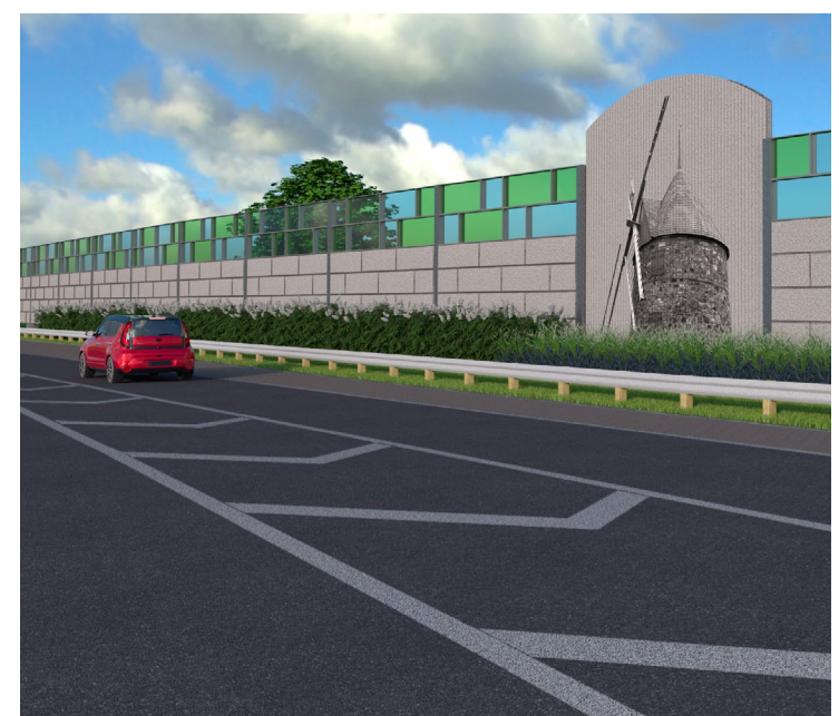
▲ Le futur écran antibruit

démontre que la Ville de Repentigny et le gouvernement du Québec travaillent main dans la main afin de mettre en place des solutions qui contribueront à assurer une plus grande quiétude aux personnes demeurant à proximité de l'autoroute 40, un axe de déplacement stratégique dans la région métropolitaine et dont les débits de circulation sont en constante augmentation », a précisé Lise Lavallée.