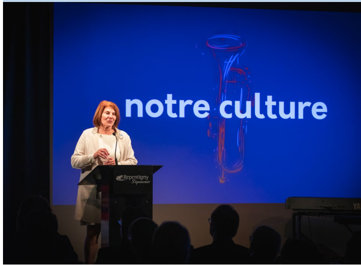
▲ Le dévouement de la programmation — novembre 2019

L'année 2020 a marqué le 350 e anniversaire de la Ville de Repentigny. Certes cette année fut difficile, mais la Ville a su se réinventer et proposer à ses citoyennes et ses citoyens des festivités dont nous pouvons être fiers.